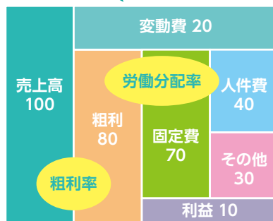
※お金のブロック図